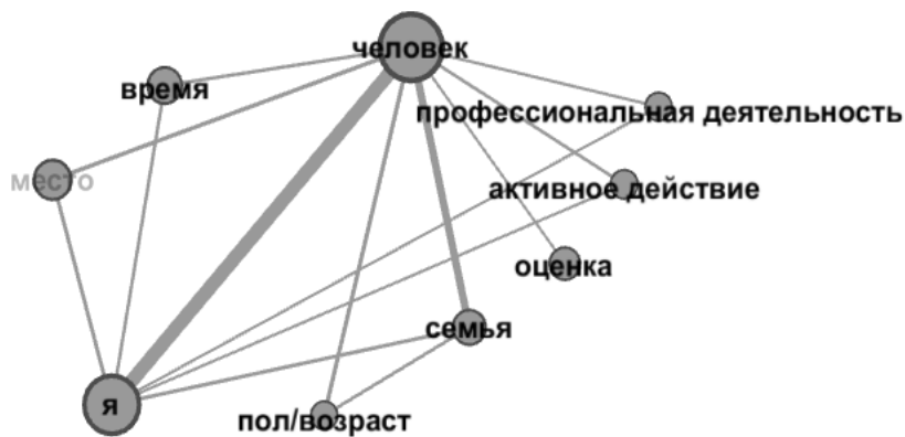
Рис. 6. Модель семантической структуры текстов женщин со средним образованием

В модели семантической структуры текстов мужчин со средним образованием (рис. 4) присутствуют микротемы из описанной выше модели – это ПРОФЕССИОНАЛЬНАЯ ДЕЯТЕЛЬНОСТЬ, АКТИВНОЕ ДЕЙСТВИЕ, ОЦЕНКА, СЕМЬЯ, ВРЕМЯ, к ним добавляются микротемы СУЩЕСТВОВАНИЕ и МЕСТО, однако отсутствуют микротемы КАЧЕСТВО, ПОЛ/ВОЗРАСТ.