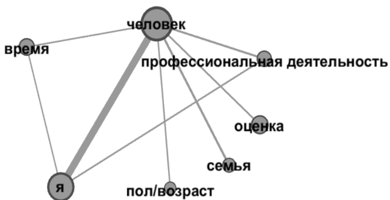
Рис. 5. Модель семантической структуры текстов женщин с высшим образованием