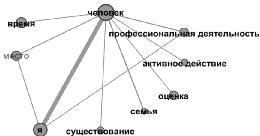
Рис. 3. Модель семантической структуры текстов мужчин с высшим образованием